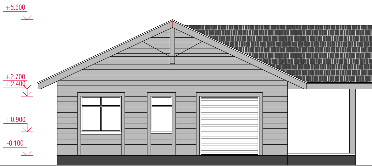
FASADAS TARP A6IŲ A - D M1:100